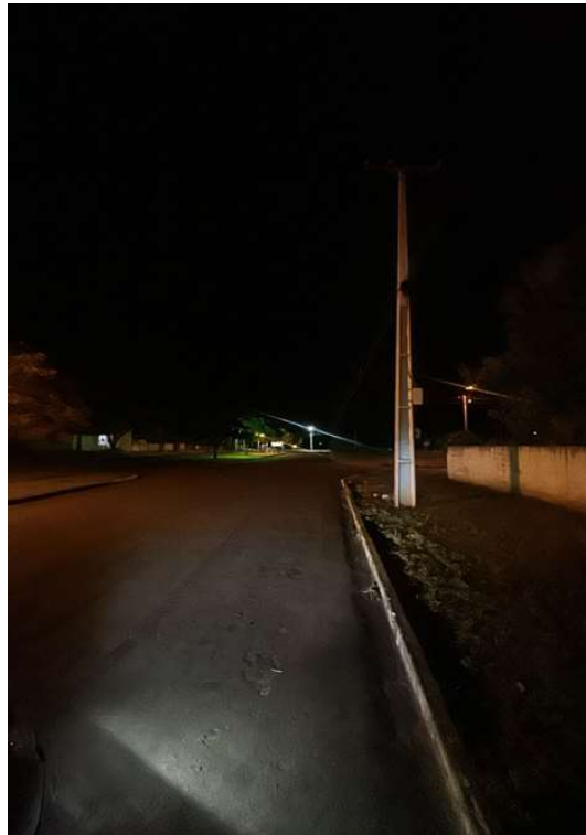
AV SANTOS DUMMONT