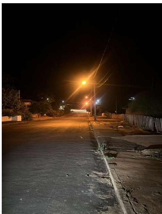
RUA MARTIN LUTHER KING