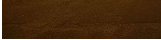
RUA PROJETADA C (PQ INDUSTRIA