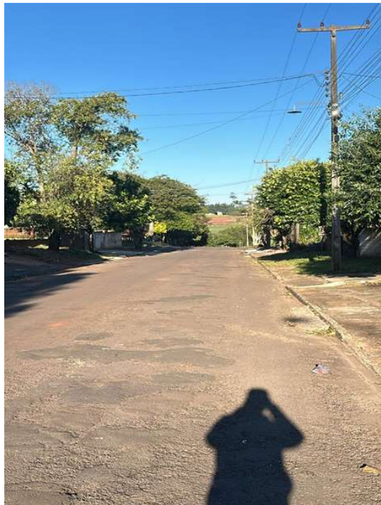
RUA PEDRO ALVARES CABRA