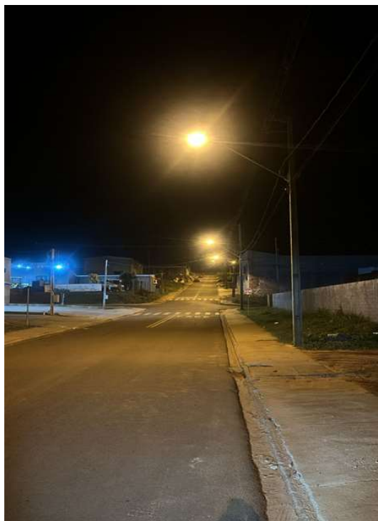
RUA PROJETADA A - PQ INDUSTRIAL