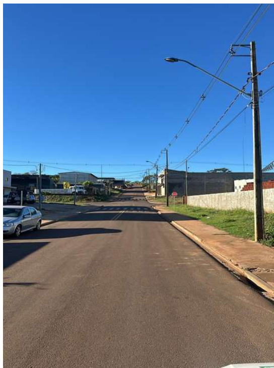
RUA PROJETADA A - PQ INDUSTRIAL