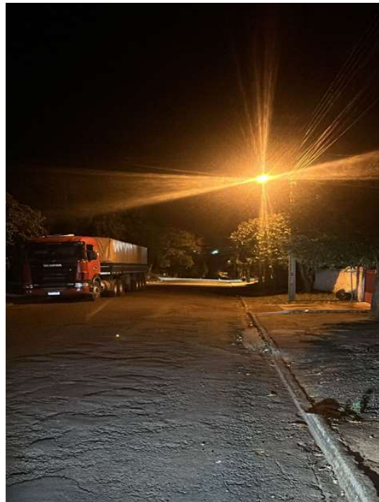
RUA PEDRO ALVARES CABR