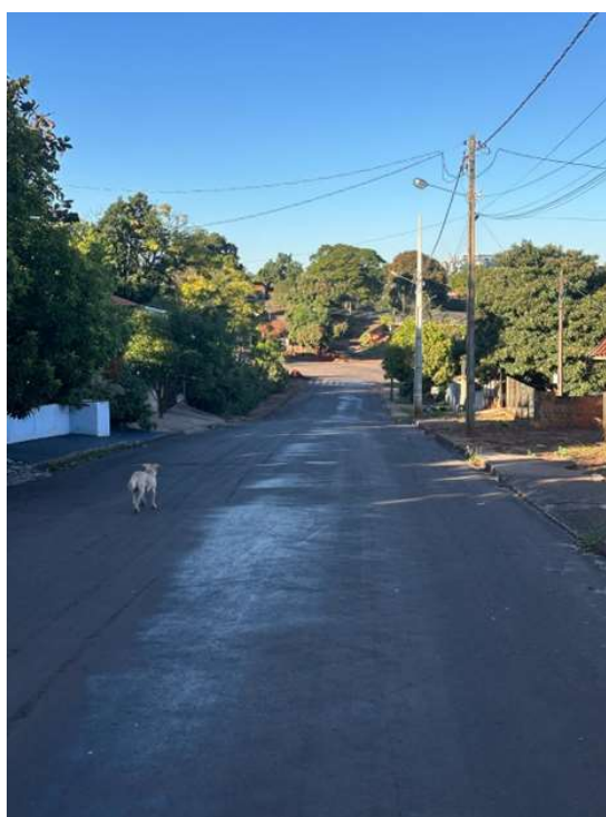
RUA MARTIN LUTHER KING