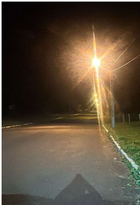
PROLONGAMENTO AV JOÃO XXIII