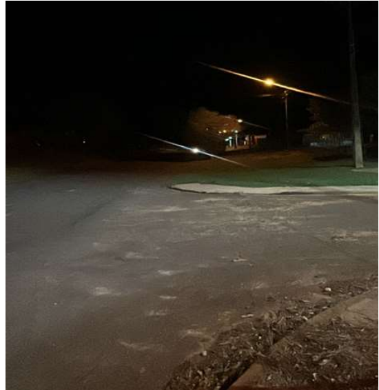
AV PRESIDENTE CASTELO BRANCO