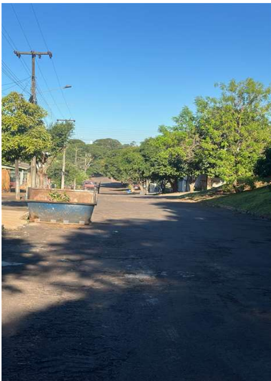
RUA SENADOR SOUZA NAVES