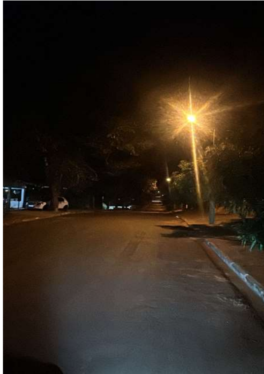
RUA KATSUO NAKATA