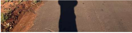
RUA PROJETADA C (PQ INDUSTRIAL)