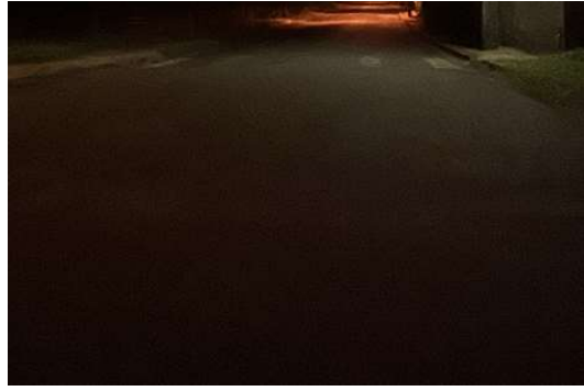
RUA THOME DE SOUZA