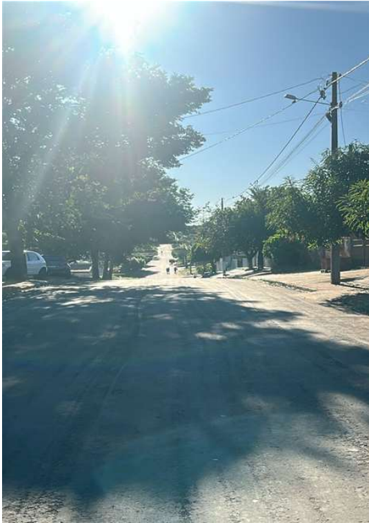
RUA KATSUO NAKATA