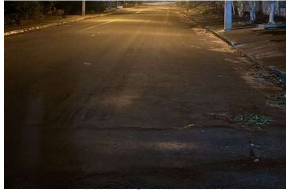
RUA JHON KENNEDY