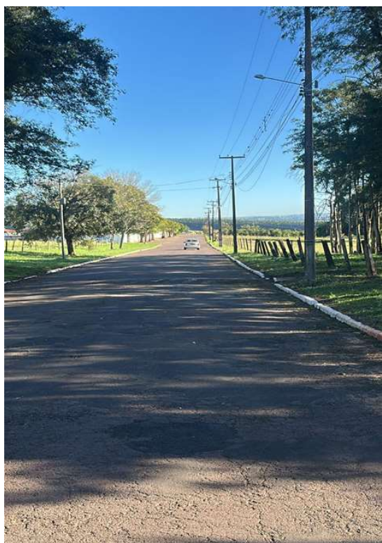
PROLONGAMENTO AV JOÃO XXIII