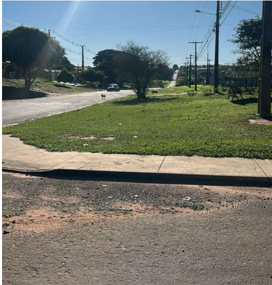
AV PRESIDENTE CASTELO BRANCO