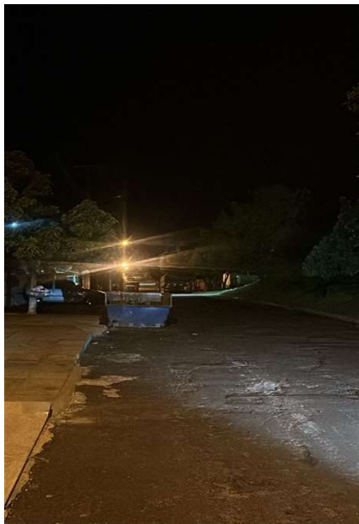
RUA SENADOR SOUZA NAVE