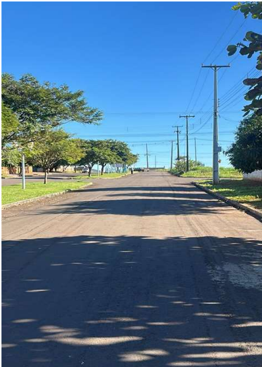
AV SANTOS DUMMONT