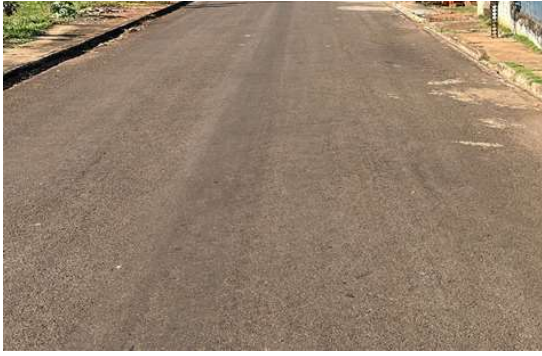
RUA THOME DE SOUZA