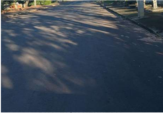
RUA JHON KENNEDY